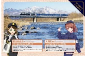
△SL 大樹記念乗車証 ※デザインは全6種類