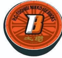
△オリジナルパック (イメージ)