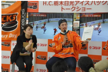
△トークショー（イメージ）