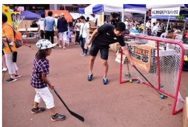
△シュート体験 (イメージ)