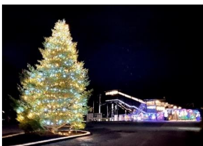
△ 新高徳駅 点灯イメージ