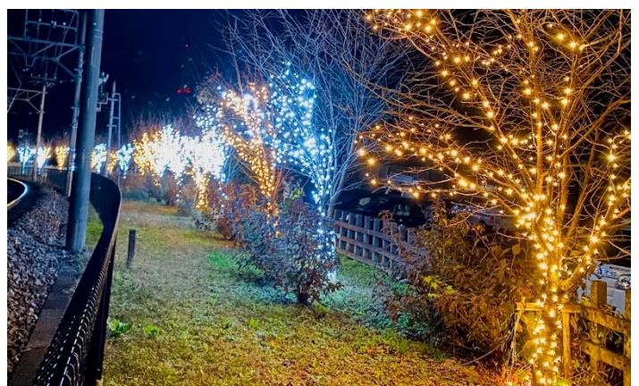
△ 沿線での点灯の様子（イメージ）