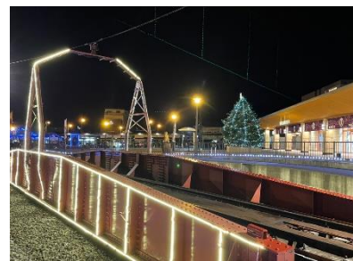
△ 鬼怒川温泉駅前 点灯イメージ