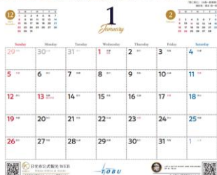
1月「雪に挑む」 △イメージ