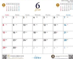
6月「紫陽花咲く新高徳駅」 △イメージ