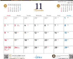
11月「季節の移り変わりを走る」 △イメージ