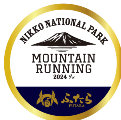
△ヘッドマークイメージ