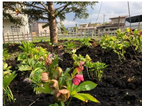
△「鬼怒川線に季節ごとの花を咲かせよう」プロジェクト