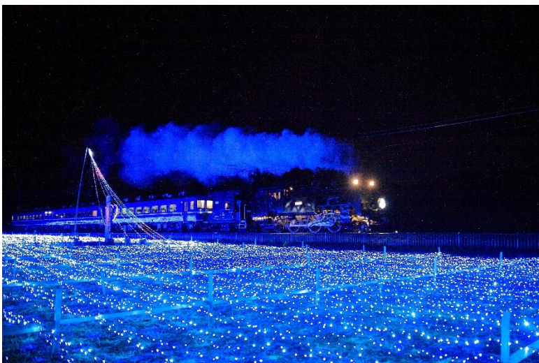
△倉ヶ崎SL花畑とSL大樹（昨年度）