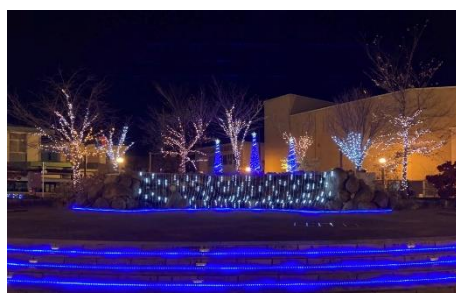
△鬼怒川温泉駅前広場