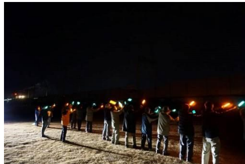
△「SL大樹にみんなで手を振ろう」プロジェクト