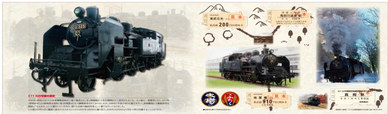
「C11 325号機 営業運転開始記念券」台紙イメージ