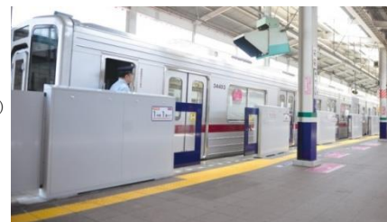
△ ホームドア (和光市駅)