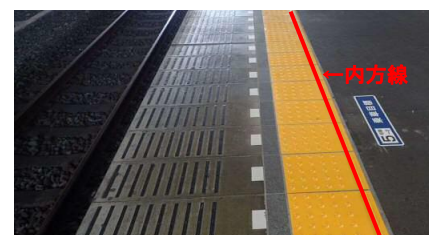
△ 内方線付き点状ブロック (イメージ)

今後、2018年度を目標に、1日のご利用者数1万人以上の全99駅に内方線付き点状ブロックを整備いたします。