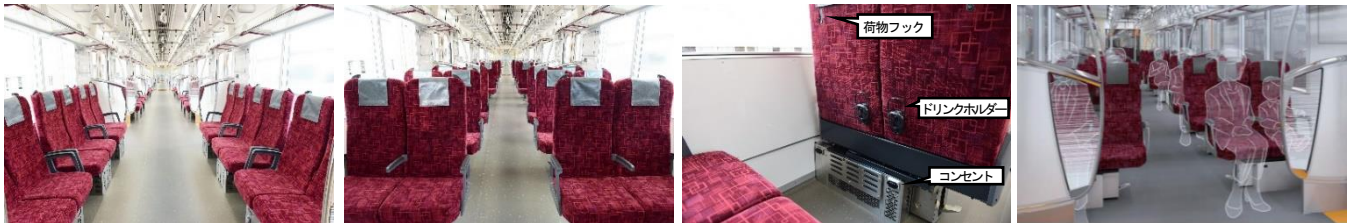
▲車内(ロングシート)

【特徴】東武鉄道「70000系」(東京メトロ日比谷線直通用車両)をベースとしたロング・クロスシート転換車両です。外観は70000系を踏襲しながらも側面のラインを車体上部に引き上げるスラッシュラインを設け、スピード感と先進性を表現しました。内装ではハイバック仕様の座席を採用し、THライナー運用時のプライベート性を確保するほか、「TOBU FREE Wi-Fi」を提供し、各座席にコンセントやドリンクホルダー、荷物フックを用意します。