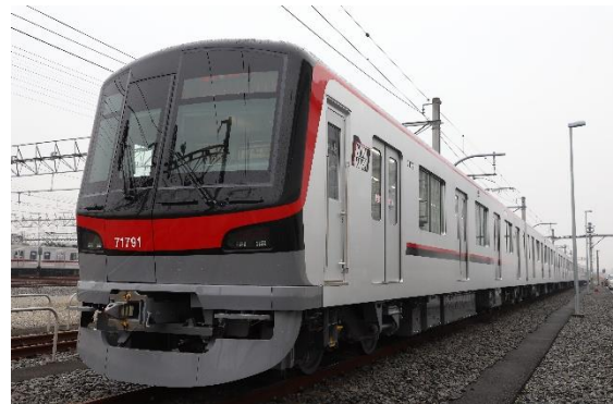
▲東武鉄道 新造車両「70090型」