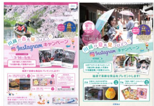
△ インスタグラムキャンペーン