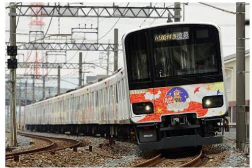
△ 池袋・川越アートトレイン