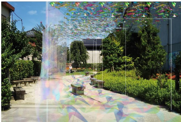
△ 鍛冶町広場での「光彩楓螢」（イメージ）

東武鉄道では、今後も関係各所と連携を図りながら、川越市の地域活性化に努めてまいります。概要は別紙のとおりです。