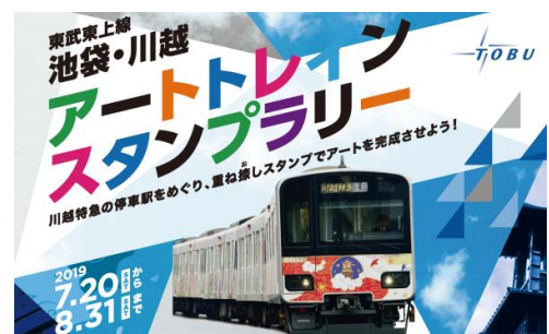
△ 池袋・川越アートトレインスタンプラリー