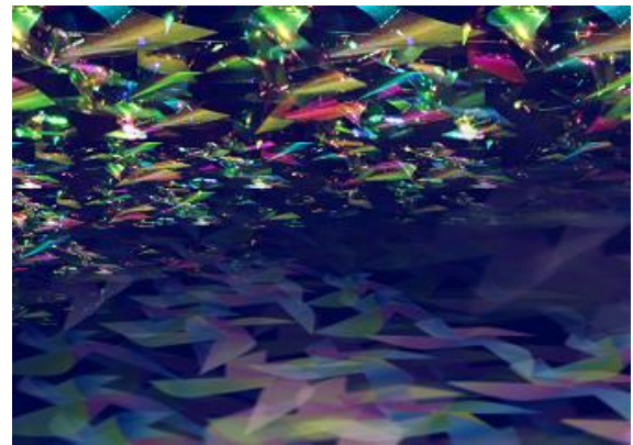
△ 「光彩楓螢」透過した光のイメージ