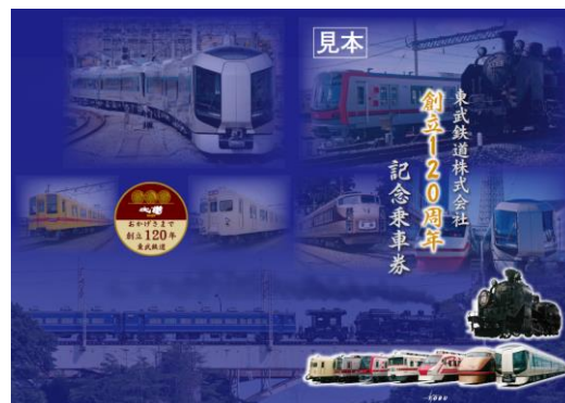
△ 「東武鉄道株式会社創立120周年記念乗車券」台紙イメージ