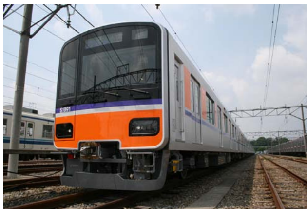
△東上線TJライナー 50090型車両