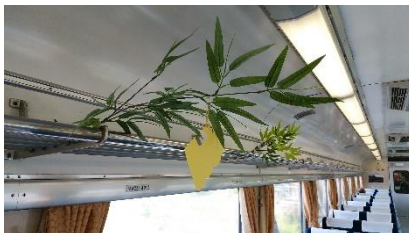
△SL大樹客車内(イメージ)