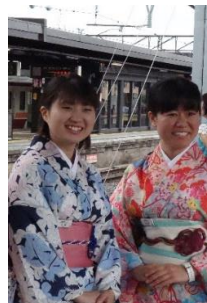
△SL観光アテンダント浴衣(イメージ)