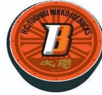
△オリジナルパック (イメージ)