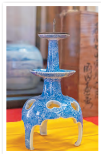
(写真上) ベリー来航の折、徳川家から賜ったという展示物の燭台 (写真左) すぐ近くには翁島と名付けられた別邸も