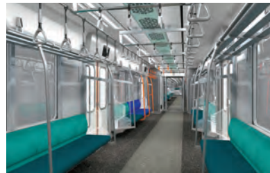
未来に向かって光が駆け抜ける様を表現したインテリア(イメージ)