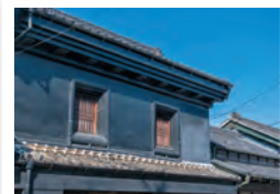
立派な見世蔵など、建物の造りを見比べることができます