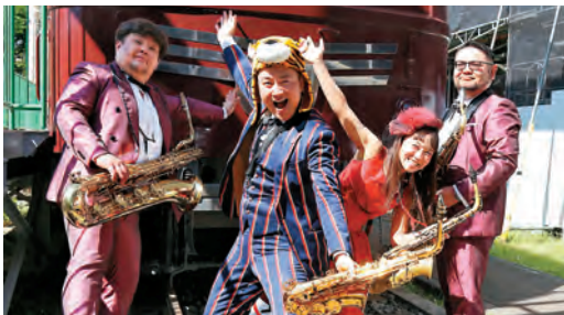
キッズコンサートに出演するホンカース