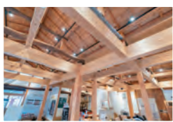
ガイドンスセンター館内の梁や柱を見れば、建物の構造を知ることができます