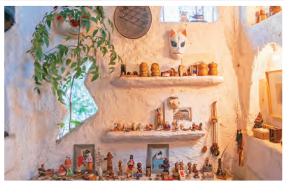
(写真上)おしゃれなディスプレイも目を引きます (写真下)古着も豊富です (写真左下)たばこ店だった店構え