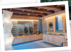
(写真右上) 大名屋敷のような堂々たる陣屋 (写真上) 土蔵には貴重な武具や生活雑貨などを展示 (写真右) 敷地内にある県内最古の理髪店も往時の姿のまま保存