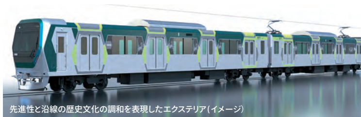
先進性と沿線の歴史文化の調和を表現したエクステリア(イメージ)