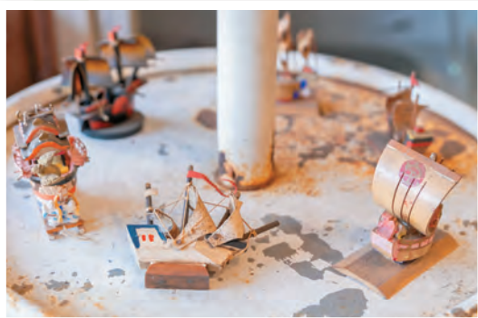
幅広いジャンルの品そろえを誇る店内。なかには自宅のインテリアにしたくなる、持ち帰るのにちょうどいいサイズの置物などもあります