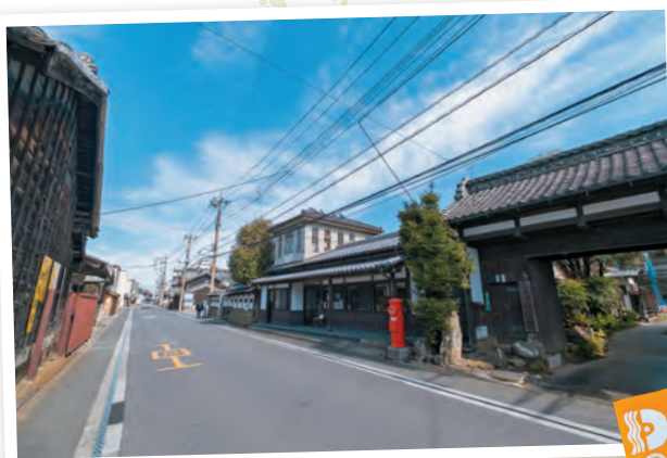
(写真左) 岡田記念館前の日光例幣使道。徳川家康没後、日光東照宮へ天皇が遣わした勅使が通った、脇街道のひとつです (写真下) 館内に展示された神輿 (写真左下) 町のロゴが描かれた手拭 1800円も販売