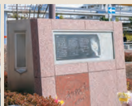
南口の駅前にある本田美奈子記念碑