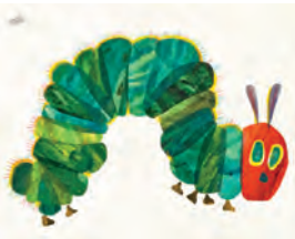
エリック・カール『はらべこあおむし』 1987年版表紙／1987年 エリック・カール絵本美術館

『はらべこあおむし』『パパ、お月さまとって!』などの絵本作品で知られるエリック・カール(1929～2021)の回顧展が開幕。米国のエリック・カール絵本美術館とともに開催するもので、上記2作品を含めた27冊の絵本の原画のほか、グラフィックデザイナー時代の作品やダミーブックなど約180点を紹介しています。