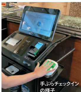
手ぶらチェックインの様子

指をかざすことで宿泊手続きが可能なチェックイン機を川越東武ホテル・和光市東武ホテルに導入！