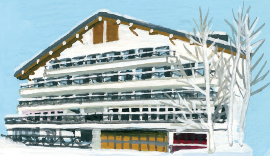
会津アストリアホテル