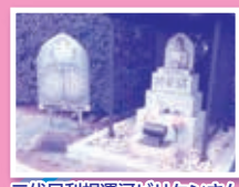
二代目利根運河ビリケンさん