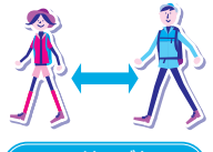
ハイキングもソーシャルディスタンス

参加されるみなさまにおかれましても、 手洗い、うがいやマスク着用を含む咳エチケット、ソーシャルディスタンス等の感染症予防対策 を心がけ、体調管理には十分ご留意いただきますようお願いいたします。また、主催者や立ち寄り先等で定める感染防止策にご協力ください。