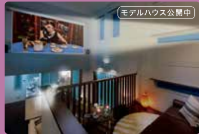
モデルハウス公開中

約500区画の分譲開発プロジェクト! 駅前の「ソライエひろば」を拠点とし、コミュニティ豊かな街づくりに取り組んでいます。