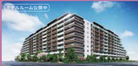
モデルルーム公開中

女性5,000人の声を集め、理想の住まいが誕生します。駅北口エリアに隣接する全352戸で、都心へのアクセスも快適です。