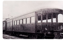
豪華展望客車(トク1形500号)とその内観