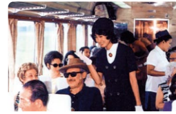
デラックスロマンスカーの車内の様子