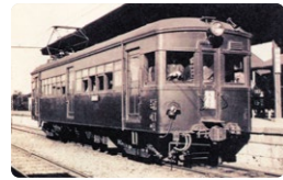
総武鉄道時代の電車