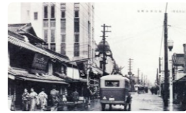
桐生市内を走るバス