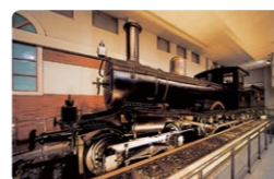
東武博物館に展示している 5号蒸気機関車