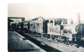
開業当時の東上鉄道