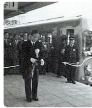
北越谷駅における日比谷線乗り入れのテープカット

1962年5月 伊勢崎線、営団地下鉄(現・東京メトロ)日比谷線(北越谷～北千住～人形町間)と相互直通運転開始