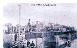
元荒川橋りょうと試運転の蒸気機関車