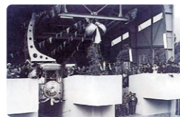
蔵王ロープウェイの開通式