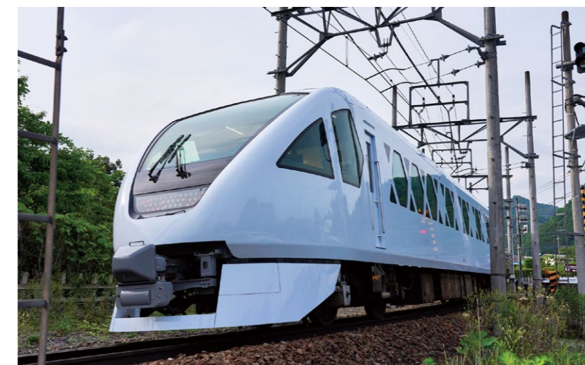
スペーシア Xの先頭車両

雄大な自然との共生、紡がれてきた歴史、新たな時代性や感覚を付加してつなぎながら、東武鉄道は日光を国際エコリゾートとして発展させる。