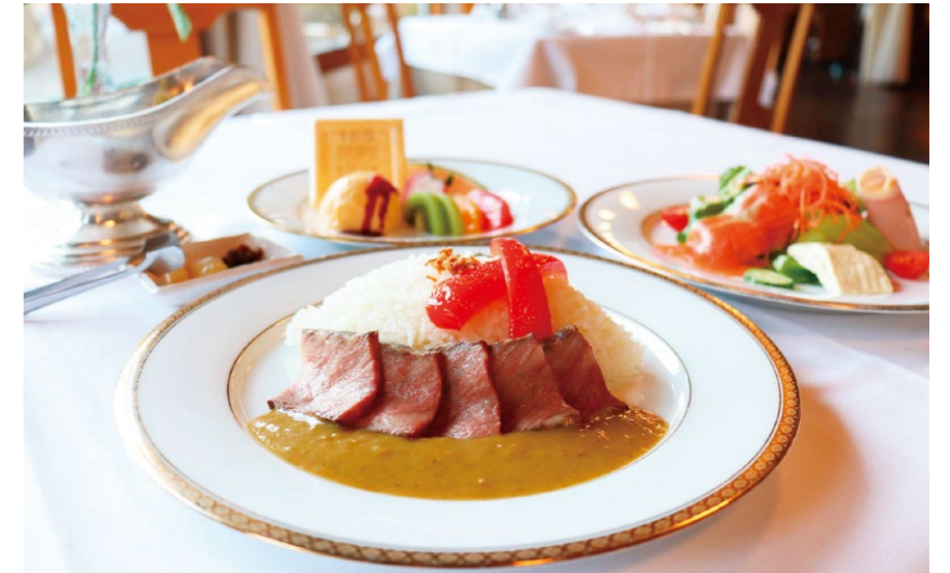
約100年前のレシピをアレンジした百年ライスカレー

その跡地をどのような宿泊施設とするか。世界からの誘客を視野に入れ、日光を新たな滞在型リゾートに変革するには、これまでにない宿泊施設が必要だった。熟慮の末、跡地には外資系ラグジュアリーホテルの