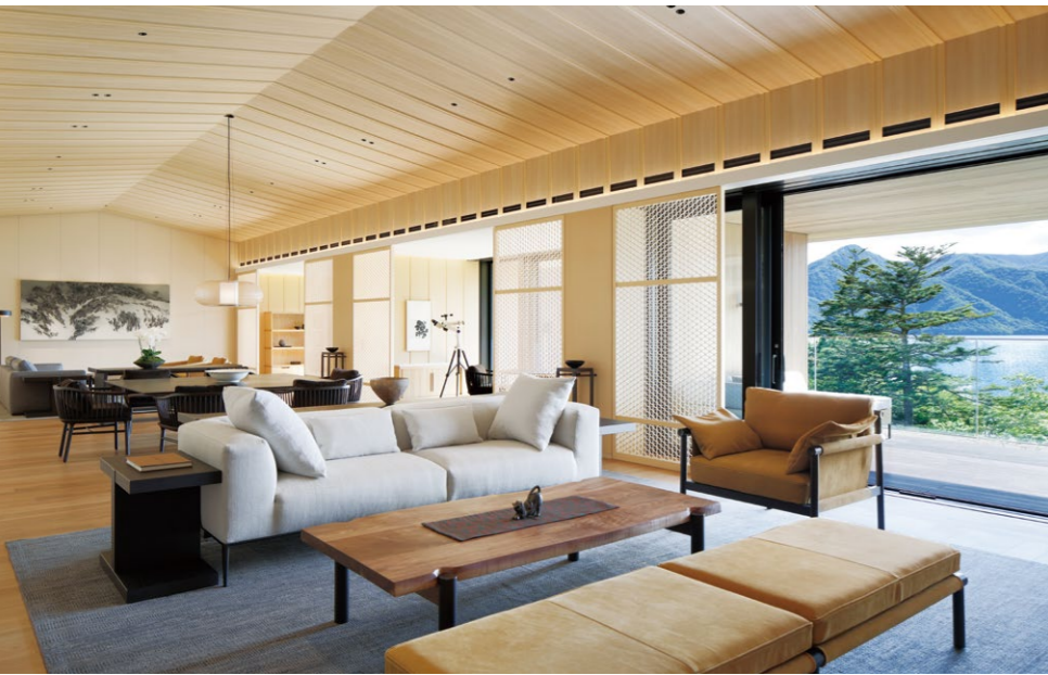
G7会合が行われたザ・リッツ・カールトンスイート

節ごとにアプローチを変えればオフシーズンがなくなり、通年での誘客が可能になるのは大きな発見だった。さらに、外資系ホテルの強大な顧客ネットワークを活用して、世界各国からの誘客も期待できる。