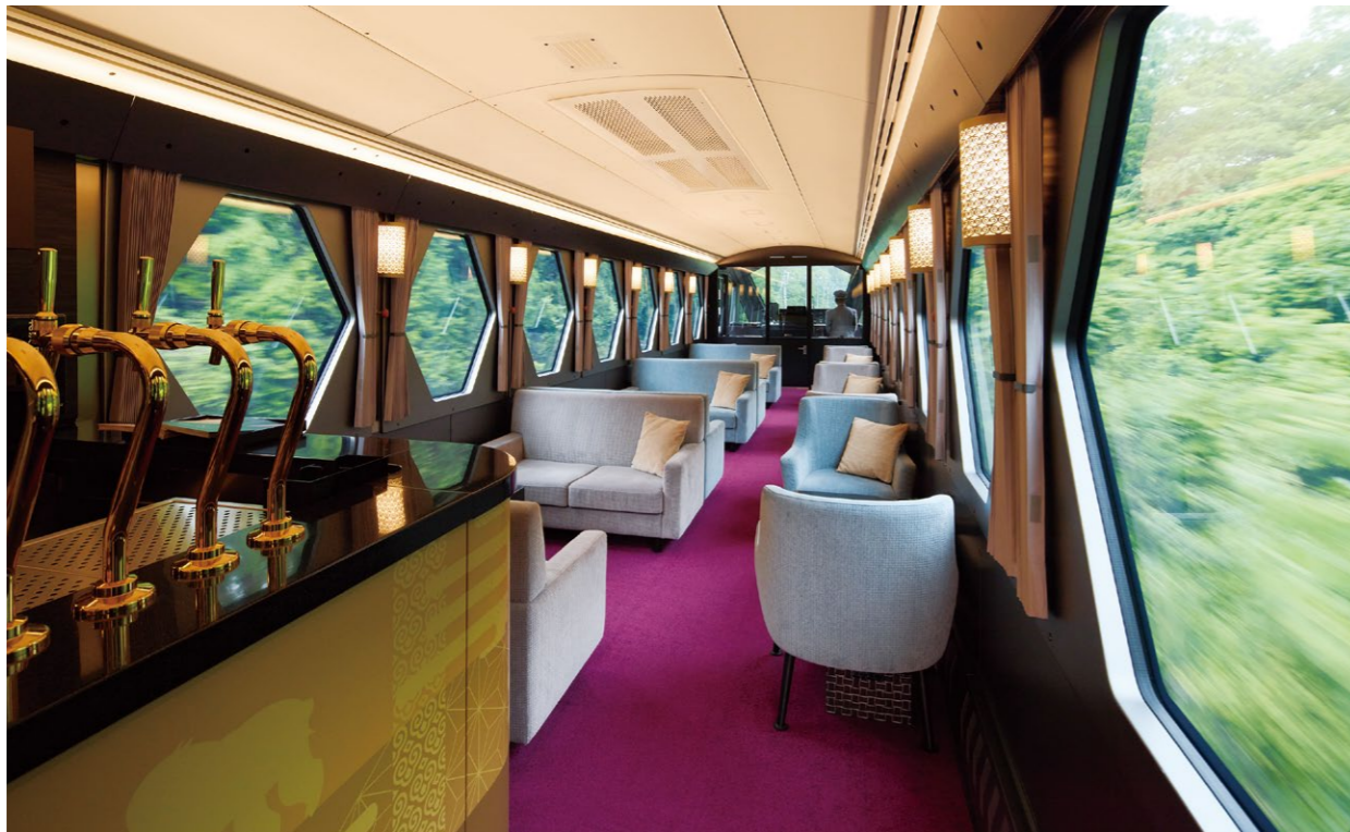
ソファ席やカフェカウンターが並ぶコックピットラウンジ

日光市地域循環によるゼロカーボンシティ実現条例を施行した。NIKKO MaaSをはじめとする東武鉄道の観光戦略「国際エコリゾート」は、サステナブルなリゾート地の醸成に貢献し、日本の観光地の1つのモデルとなっている。