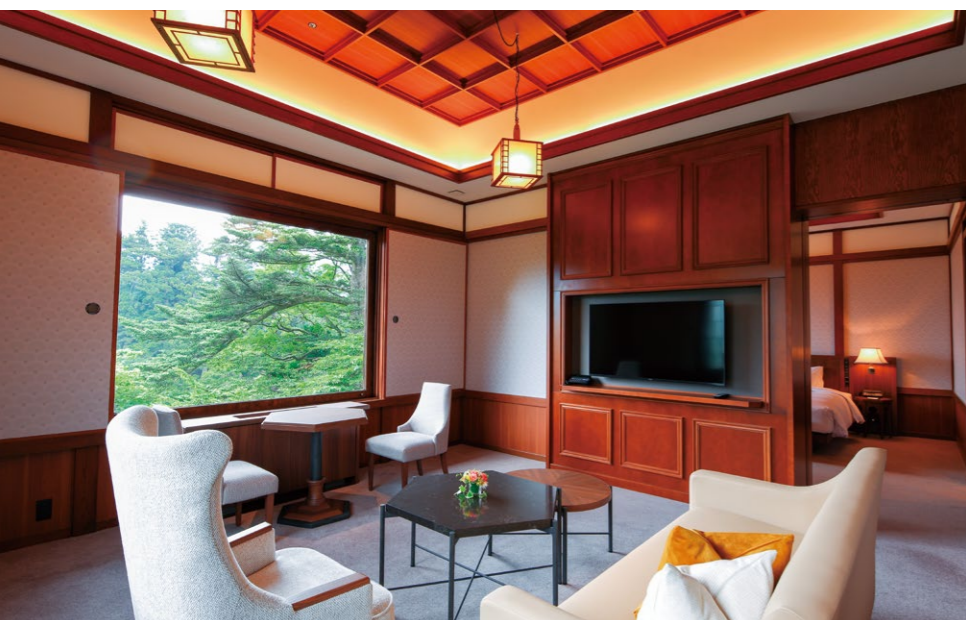
日光金谷ホテル 別館ROYAL HOUSE ロイヤルスイート

一方で、外資系ホテルが持つ「海外からの視点」は、東武グループに多くの学びや気づきを与えた。例えば中禅寺湖畔は、厳寒期の国内観光客の利用は少なかったが、雪が降らない地域に住む外国人にとっては雪や寒さが貴重な経験になる。国や季