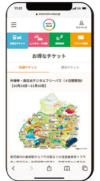
NIKKO MaaSは日光エリアの移動や体験を網羅