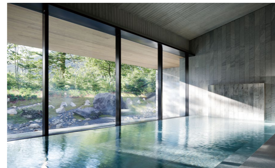
館内には露天風呂付きの温泉大浴場を備える