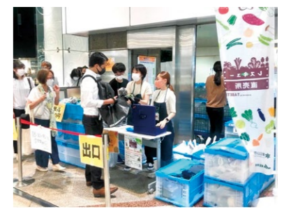
輸送した野菜は池袋駅構内で販売