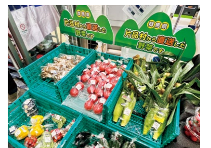
東武ストアの店頭と並んだ片品村産の野菜