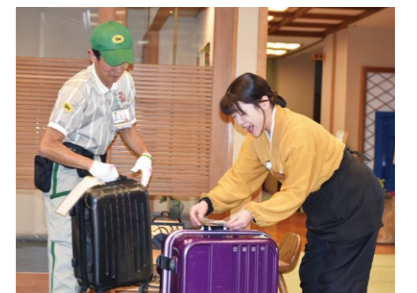
観光客の荷物はバス停まで輸送された後、ヤマト運輸ドライバーが各宿泊施設まで運ぶ