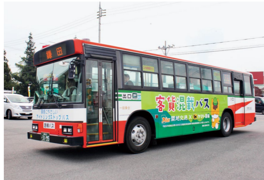
関越交通の鎌田線を走る客貨混載のラッピングバス

本格運用初日となった2021年8月2日には、東松山市に加えてフードロス削減サービス「TABETE」を運営するコークッキング、農産物の提供元であるJA埼玉中央、企画運営などを担う大東文化大学と連携協定を締結した。それぞれのリソースを生かして効率的な運営を検討・実行し、一過性のものでなく継続して実施できる体制を整えた。