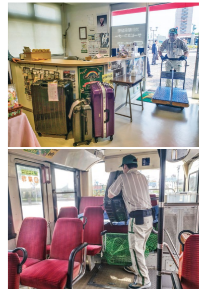
伊香保温泉で始まった「手ぶら観光」では、観光客から預かった荷物を路線バスで輸送する

いわゆる「2024年問題」の影響で、物流業界はビジネスモデルの転換を迫られている。コロナ禍で売り上げが落ち込んだ旅客運送事業の再起を図る上で、物流事業者との連携や新たな輸送サービスの構築は重要な鍵を握る。今後も鉄道やバスの強みを生かし、公共交通の持続可能性を模索していく。