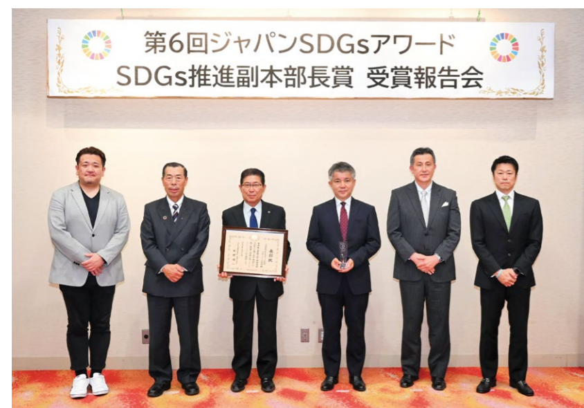
2023年3月17日、第6回ジャパンSDGsアワードでSDGs推進副本部長賞を受賞した6団体の代表者ら

旅客と貨物の輸送を同時に行うこと。「貨客混載」とも。公共交通の維持や物流網の確保を背景に、2017年から一定の条件下において旅客と貨物の混載が可能になった。