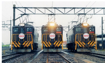
2003年9月20日・21日に開催された「さようなら貨物列車」イベント風景

東武鉄道の貨物列車は1899年8月、北千住～久喜間の開業とともに運行を開始した。その始まりは、絹織物の一大産地であった両毛地域と東京をつなぐことにあった。英国の産業革命で発展したリヴァプール・アンド・マンチェスター鉄道 ※1 のよ