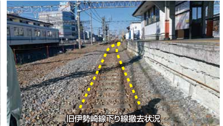
旧伊勢崎線下り線撤去状況