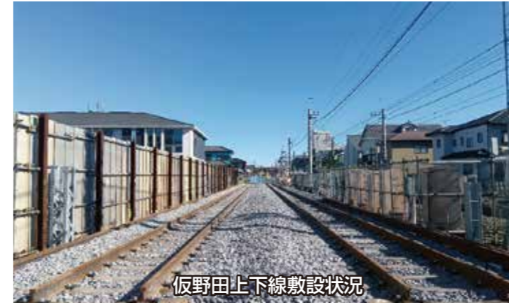
仮野田上下線敷設状況

東武伊勢崎線(東武スカイツリーライン)春日部駅付近は、2025年10月に伊勢崎下り線の仮線切替えを実施し、伊勢崎仮下り線および仮下りホームの使用を開始しました。今後は、旧伊勢崎下り線および下りホームの一部を撤去し、野田線の仮線化に向けて軌道工事、土木工事、電気工事を行っていきます。