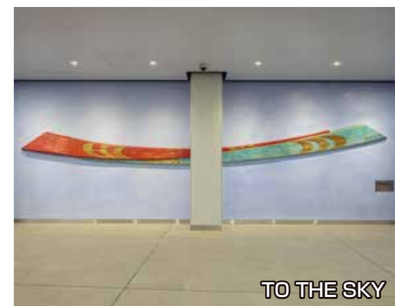
TO THE SKY