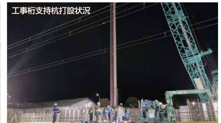
工事桁支持杭打設状況