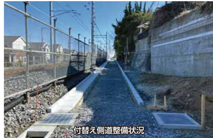
付替え側道整備状況