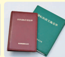
きそくしゅう 規則集