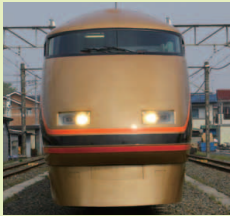
100系 日光詣スペーシア