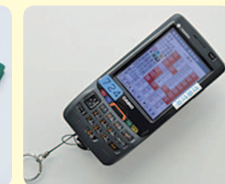
とくきゅうれつしゃようたんまつ かい 特急列車用端末機