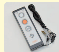
はつしゃ メロディー用リモコン