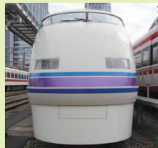
100系 雅(みやび)調スペーシア