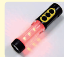
あいずとう 合図灯