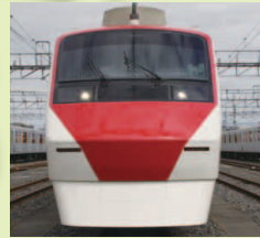
200型 台鉄「管悠環(ふゆま)」デザイン りょうもう号