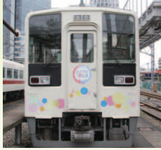
634型 スカイツリートレイン