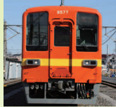
8000系 昭和30年代「標準色」リバイバルカラー