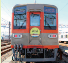
8000系 ツートンカラー リバイバルカラー