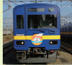
50090型 フライング乗上 リバイバルカラー