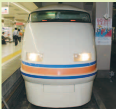
100系 サニーコーラルオレンジ スペーシア