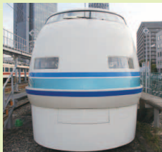
100系 粋(いき)調スペーシア