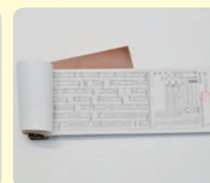
しゃないほじゅうけん 車内補充券