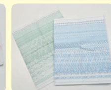
さんこうずひょう 運行図表