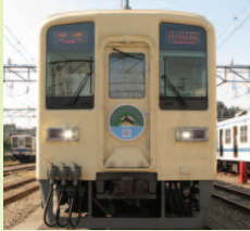
8000系 センジクリーム リバイバルカラー