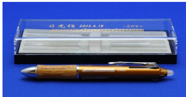
△「日光詣スペーシア フリクションペン」