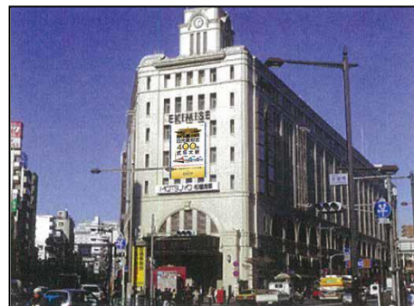
△誘客PR幕の掲出（イメージ）