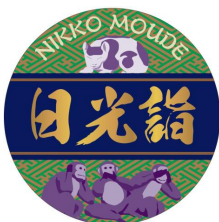
△「日光詣エンブレム」イメージ