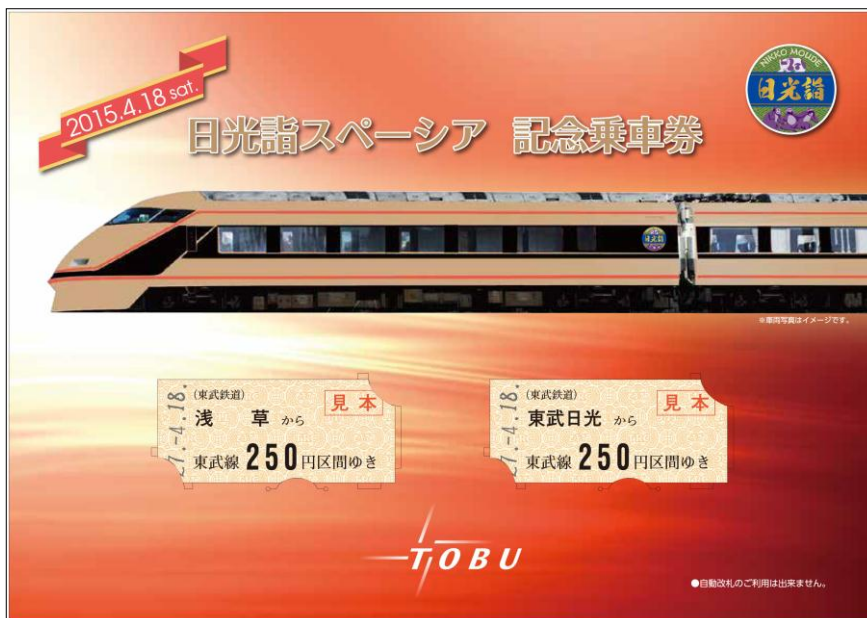
△「日光詣スペーシア記念乗車券」イメージ