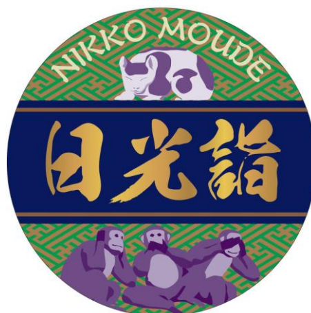
△「日光詣エンブレム」イメージ