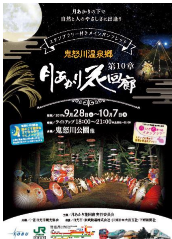
△ 月あかり花回廊 第10章

※詳細は、月あかり花回廊事務局（日光市観光協会 鬼怒川・川治支部内、0288-22-1525）までお問合せ下さい。