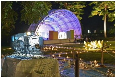
△SL大樹オブジェの展示（イメージ）