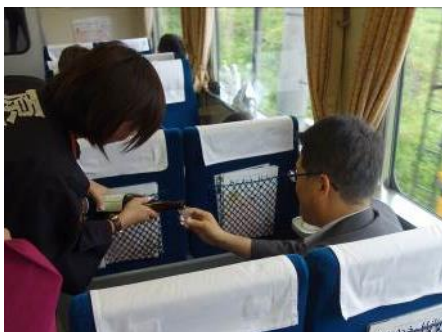
△地酒の振る舞いの様子（イメージ）