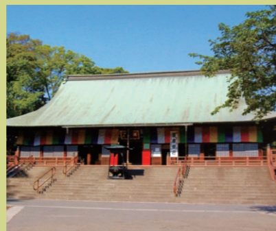
▶從川越站步行約20分鐘

從藏造建築街道稍往前進入小巷處，就是排列着20多家點心舖、洋溢着懷舊情調的街道。從面向兒童的小粗點心，到餡糖或丸子，及採用川越名產甘薯獨創的點心，您會邂逅到各種各樣的點心。