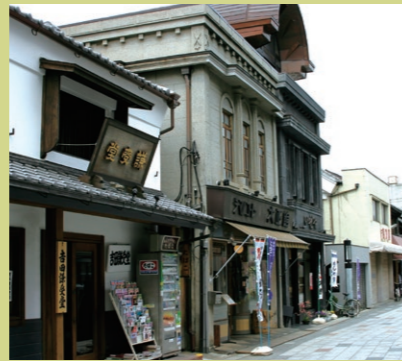
▶從川越站步行約20分鐘

A: 9:00~17:00(最後入館時間為16:30) B: 星期日(節假日時則隔日) · 年底年初, 第4個星期五 C: 成人100日圓, 大學生和高中生50日圓, 中學生以下免費