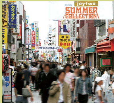
▶從川越站步行約1分鐘

A: 營業時間 B: 定期休息日 C: 入場費 ♀: 最近的巴士站名 ①~⑥: 川越站東口的巴士乘車口號碼