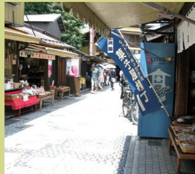
▶從川越站步行約35分鐘

※到2016年12月為止，因為耐震工事，有時停止撞鐘以及建築物將被遮蓋無法欣賞。(預定)