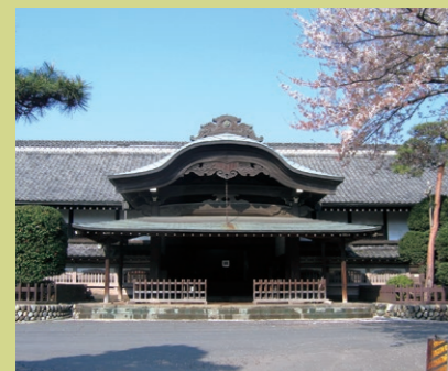
▶從川越站步行約40分鐘

建於1848年的川越城的本丸御殿(本丸御殿:城中心的城郭和大屋)。唐破風樣式的正門部分保留着有特色的外形，讓您感受到武家的威風。即使在日本國內，本丸御殿現存的城郭也為數不多，是寶貴的史蹟。