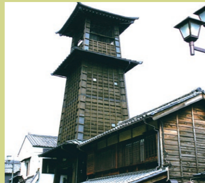
▶從川越站步行約30分鐘

在這裡您感受到古色古香的大正時代之浪漫的商店街上，排列着許多懷舊的建築。不但有西方式建築，還有庫房或木造的建築，您可欣賞到意趣淳厚的景觀。讓我們一邊觀賞奇特的建築物，一邊享受一下閒逛及購物的樂趣吧!