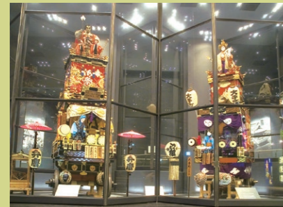
▶從川越站步行約30分鐘

這一街道，排列着許多由灰泥牆和左右對開的門構成的建築，代表着小江戶穿越的景觀。仔細地看，您會發現各個建築物的構造不同，一邊遊逛一邊對比一下每座建築也挺有意思的。