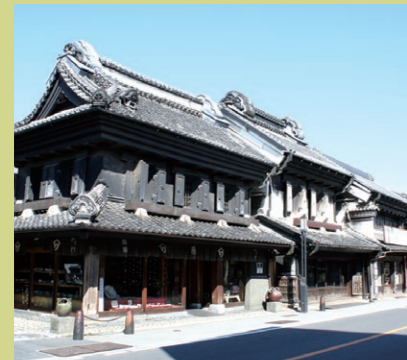
▶從川越站步行約25分鐘

從川越站東口的北側開始，長達1公里以上的商店街。今日映照出充滿生氣的風貌，這是一條熱鬧的街道。各種各樣豐富多彩的店鋪鱗次櫛比，購物的顧客往來熙熙攘攘。